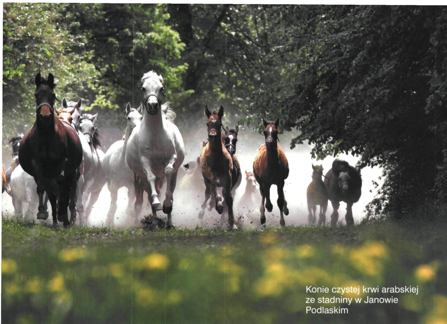
Konie czystej krwi arabskiej ze stadniny w Janowie Podlaskim

go wystawili 26 klaczy i jednego ogiera. Sprzedano 13 klaczy (ogier Eurykles nie znalazł nowego właściciela). Najtańsze klacze kosztowały 4 tys. euro, najdroższa – 20 tys. euro.