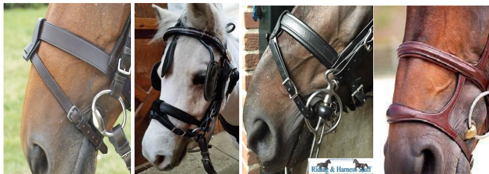
(nachrapnik ze skośnikami lub z dolnym paskiem)