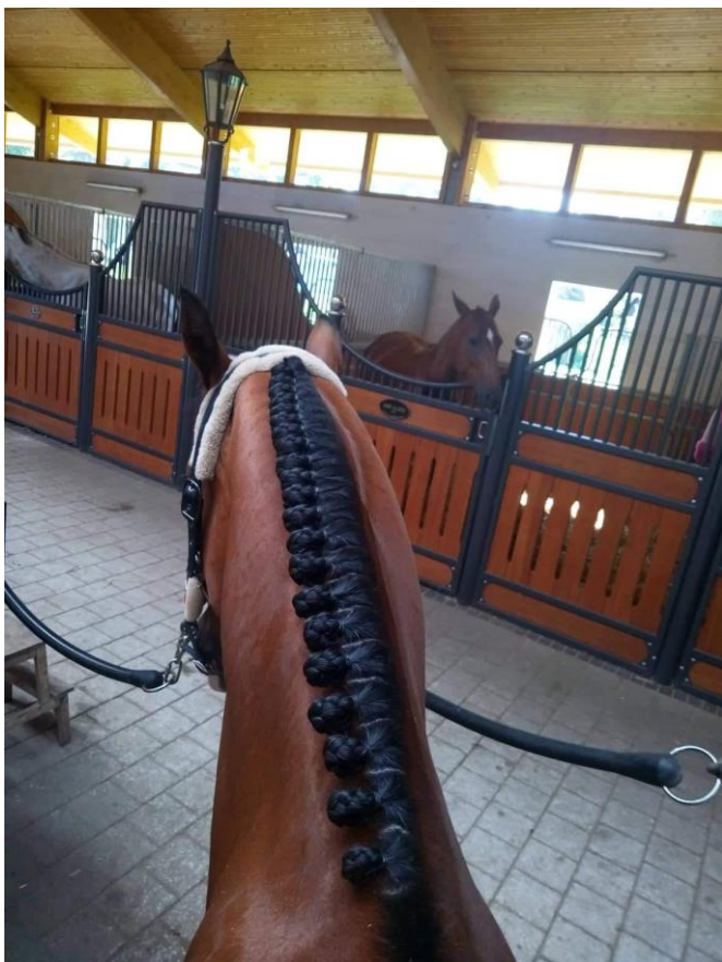
Przykład prawidłowo zaplecionej grzywy (fot. i wykonanie Magdalena Dziubińska).